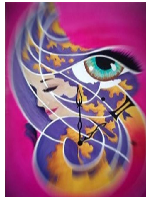
La mirada del tiempo

Obra del Taller Vincent Van Gogh, del C.P. de Albolote. ESP